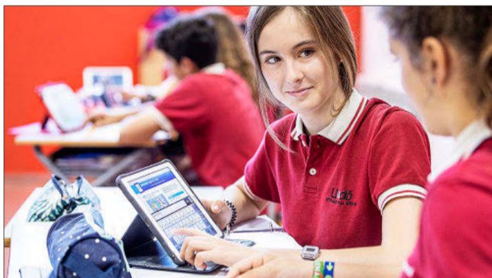
Instalaciones, director y alumnado de Ágora Lledó. E. M.